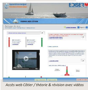
Accès web Côtier / théorie & révision avec vidéos