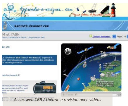
Accès web CRR / théorie & révision avec vidéos