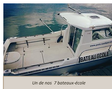
Un de nos 7 bateaux-école