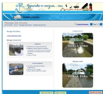
Accès web fluvial théorie avec vidéos