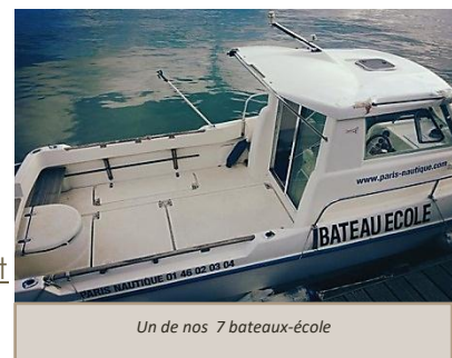
Un de nos 7 bateaux-école