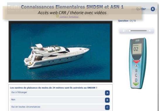
Votre module exercices CRR web